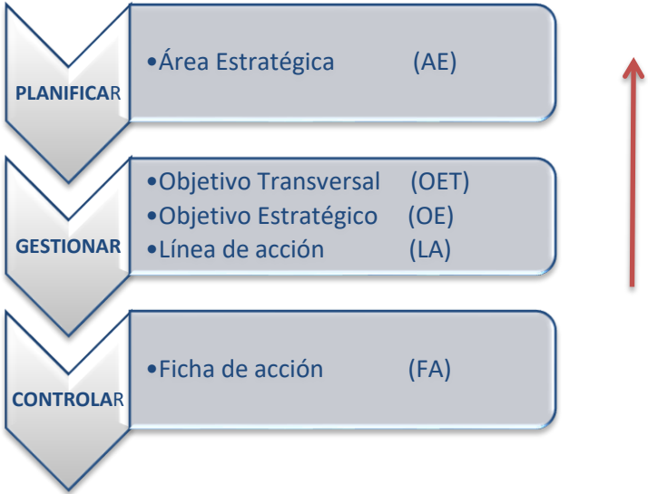
Ilustración 4: Composición de las AE, OE, OET, LA del Pladeco 2019-2024

Las Fichas de acción (FA) se encuentran a nivel operativo y están asociadas a una Línea de acción (LA), y éstas a un Objetivo Estratégico (OE) que compone un Área Estratégica (AE) u Objetivo Estratégico Transversal (OET). Así, la estructura del código (metadato) tiene un orden acumulativo y en dirección ascendente.