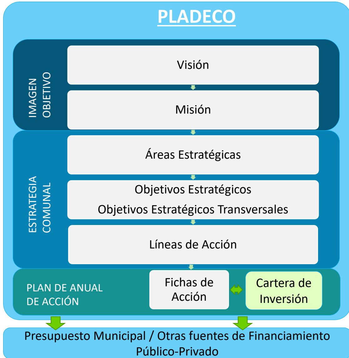
Ilustración N° 1: Modelo de Planificación Estratégica Pladeco 2019-2024